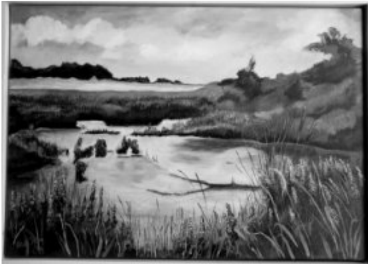
Eén van Corrie's schilderijen. Foto: Corrie de Ring

alleen maar een praatje mee maakt in plaats van dat je er een dieper gesprek mee voert. Zo ook deze keer. Op een maandagochtend rijd ik naar de Krûme Swijnswei en breng een bezoek aan Corrie de Ring. Ik ben op het pad van Corrie gekomen door een tip van iemand die vertelde dat ze mooi zou kunnen schilderen. De meeste mensen kennen Corrie als een introverte vrouw die gastvrouw is bij het museum. Ook zien we Corrie met regelmaat op het terrein met haar trekzak de gasten vermaken met mooie muziek. Een tijdje geleden voeren we met de gastvrouwen van het museum in de turfbok naar het aquaduct. Het was een mooie