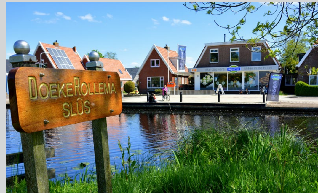
Het nieuwe aanzicht van de Dagwinkel.

Op het ambtelijk overleg met de gemeente zijn verschillende punten die verbeterd kunnen worden, besproken. Ook is hier het onderhoudsplan voor de komende jaren bekendgemaakt. Dit jaar wordt gewerkt aan betonherstel op de Geawei, herstel van de kantstrook op de Prikkewei en de scheuren in de Gearen worden gerepareerd. Voor 2019-2021 staat onderhoud aan De Ripen, de Leppedyk, de voetpaden op de Doarpsstrjitte, het fietspad op de Domela Nieuwenhuisweg in de planning en op het stuk Geawei vanaf de Gearen komt een strook van 100 meter beton.