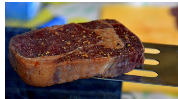
De jury let erop dat de grillsporen op de ribeye allemaal even bruin zijn.

We zijn nu 1 minuut 43 verder en Maarten snijdt de biefstuk aan. Dan blijkt waarom hij terecht tot de uitverkorenen van het WK behoort. Mals, bijna smeltend op de tong en elk stukje vlees is weer anders van smaak. Voortreffelijk. Maar wat zal de jury zeggen?