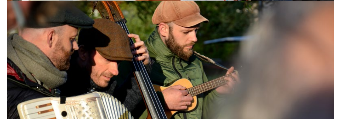
De werkstukken van de scholieren maakten indruk op de bezoekers | De muzikanten van Baragan waren beslist van meerwaarde