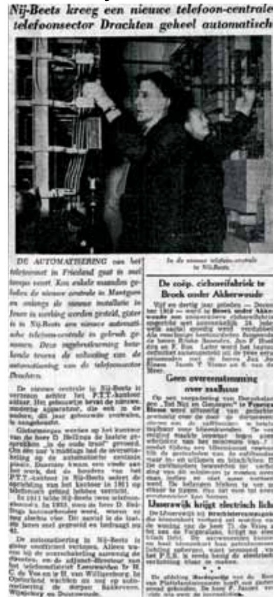
Op 17 december 1954 werd in Nij Beets een gloednieuwe telefooncentrale geopend. We hadden immers al 42 telefoonabonnees.