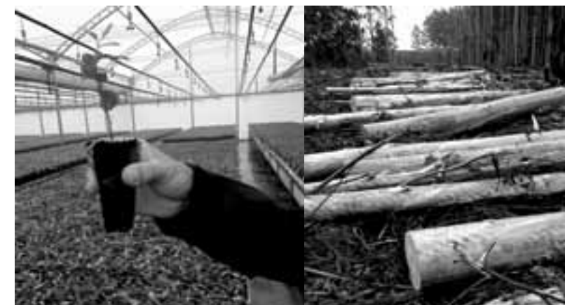
Alles begint bij kleine stekjes in de kas. Na 23 jaar zijn de bomen kapklaar.

'In Nederland is onze groep nu de enige die vijf jaar lang exclusief deze Red Grandis mogen gebruiken voor onze kozijnen. En dat doen we niet omdat het commercieel aantrekkelijk is maar vooral omdat het eerlijk hout is. Geen hout dat in oerwouden wordt gekapt en de vogels en aapjes verjaagt, maar bomen die in speciale productiebossen groeien en die CO 2 teruggeven in de lucht en waarbij de arbeiders ook nog eens een eerlijk loon verdienen.'