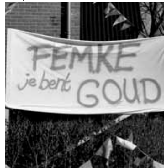
De buurt had voor een prettige welkomstsfeer gezorgd voor de kersverse wereldkampioene.

Femke reed op de 500 en 1000 meter naar een zilveren medaille maar reed op de 1500 een sublieme tijd die goed was voor goud. Een achtste stek op de 3000 bleek daarmee genoeg voor de wereldtitel. De titel was voor Femke een grote verrassing. 'It wie de alderearste kear dat ik bûten op in keunstbaan ried. It wie hielendal nij.' Gelukkig waren de omstandigheden voor buiten schaatsen optimaal. 'It waar is hiel moai, der wie allinne mar sinne. Dat allinne is al moai, om mei dy omstannichheden op in bûtenbaan te riden, en as je dan wrâldkampioen wurde, dan is dat wol hiel moai.'