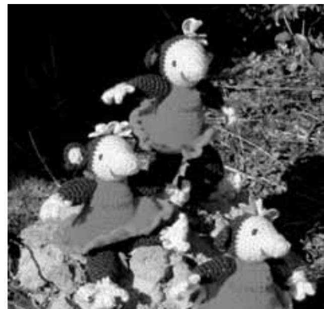
Worden deze mopjes misschien van u?

Moppie Mol heeft een persoonlijkheid: ze houdt er niet van als haar kleren vies worden. Hoe ze dat oplost? Daar komt de Nijs Beetster op terug wanneer het boekje klaar is en de presentatie bekend! Misschien dat we een volgende keer Rien aan jullie voorstellen, of Krijn, of het recept voor de 'blubbertjes brij' vertellen ..... It Damshûs is blij met het gezamenlijke 'project' en zorgt ervoor dat het lees- en voorleesboekje uitgegeven kan worden.